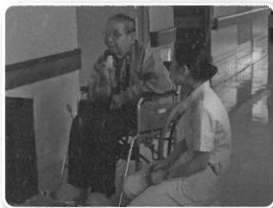
コミュニケーションを取りながら体調確認