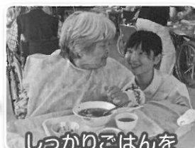
しっかりごはんを食べて下さいね!