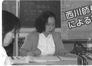
西川師長による講義