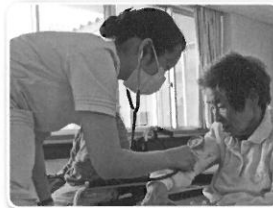
バイタルチェック