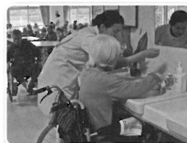
食前の衛生指導中

関西福祉大学 看護学科学生の皆さんが、「老年看護学」の実習に来られています。看護師の卵の学生の皆さんは、真剣に活き活きと実習に取り組んでいます。利用者の皆さんも若いパワーをもらって明るく笑顔も増えたように思います。