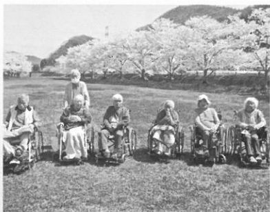
鞍居のお花見スポットへ、お出かけしました♡