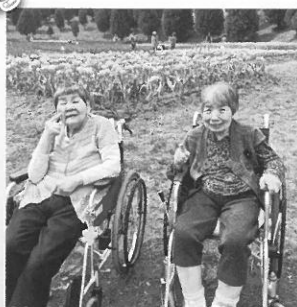
テクノポリスにて、色とりどりのチューリップを見てハイポーズ♪