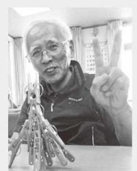
洗濯バサミアートだぜ