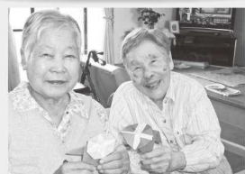
折り紙で朝顔作り