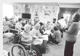
ハッピーさんの歌♪