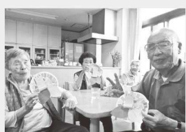
紙皿でアジサイ作り