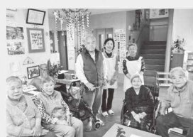
カフェのひととき