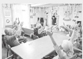
リハビリ体操で〜す